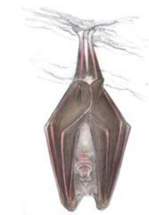
Grand rhinolophe ( Rhinolophus ferrumequinum )