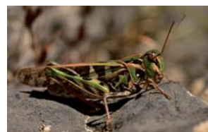
Cedipode soufrée ( Cedipoda decorus )

Pas à pas détaillé de l'itinéraire et plus de randonnées sur : cheminsdesparcs.fr