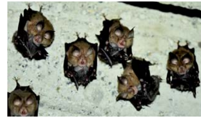
Colonie de petits rhinolophes ( Rhinolophus hipposideros )

Les chauves-souris trouvent à proximité un environnement favorable: terrains de chasse (pelouses et garrigues de Bellevue), ressource en eau (ruisseau de l'Ausset) et sites d'hivernage (mines de gypse sous les crêtes de Bellevue).