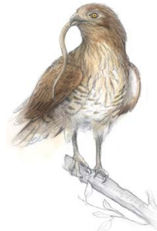
Circaète Jean-le-Blanc ( Circaetus gallicus )