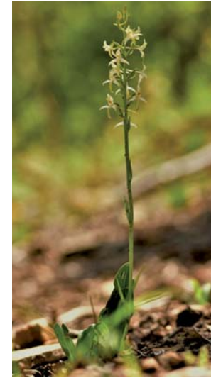
Platanthère à deux feuilles ( Platanthera bifolia )