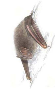
Barbastelle d'Europe ( Barbastella barbastellus )