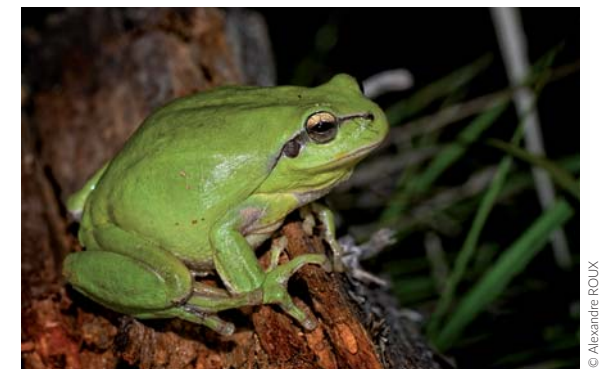
Rainette méridionale ( Hyla meridionalis )

www.onf.fr/vivre-la-foret/forets-de-france/+/17ac::foret-domaniale-de-pelicier.html