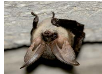
Oreillard gris ( Plecotus austriacus )