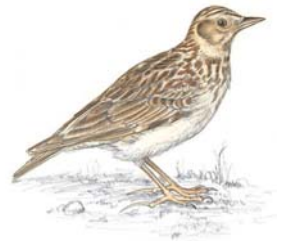
Alouette Lulu ( Lullula arborea )