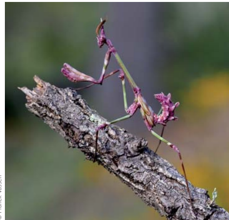
Empuse pennée ou Diablotin ( Empusa pennata )

Rares dans le paysage forestier du Luberon oriental, les pelouses sèches et les garrigues sont des milieux remarquables et essentiels pour de nombreuses espèces patrimoniales. Autrefois entretenus par le pastoralisme, bon nombre de ces habitats sont aujourd'hui délaissés. Les arbres et arbustes s'y installent progressivement, formant des espaces semi-boisés: les matorrals. La gestion des milieux et le maintien du pastoralisme contribuent à la préservation des pelouses et de leur biodiversité.