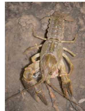
Écrevisse à pattes blanches ( Austropotamobius pallipes )

“ À l'ombre du Luberon Ce ne sont plus des cris des jets de lave Tout simplement des soupirs de montagne Et l'aube s'impatiente (...) Et voici la Durance Pays du vin et de l'amande où midi est sans ombre Avec au loin les Alpes si proches !” Claude Braun pour DLVAgglo