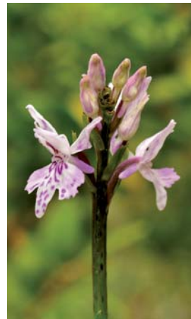
Orchis de fuchs ( Dactylorhiza fuchsii )