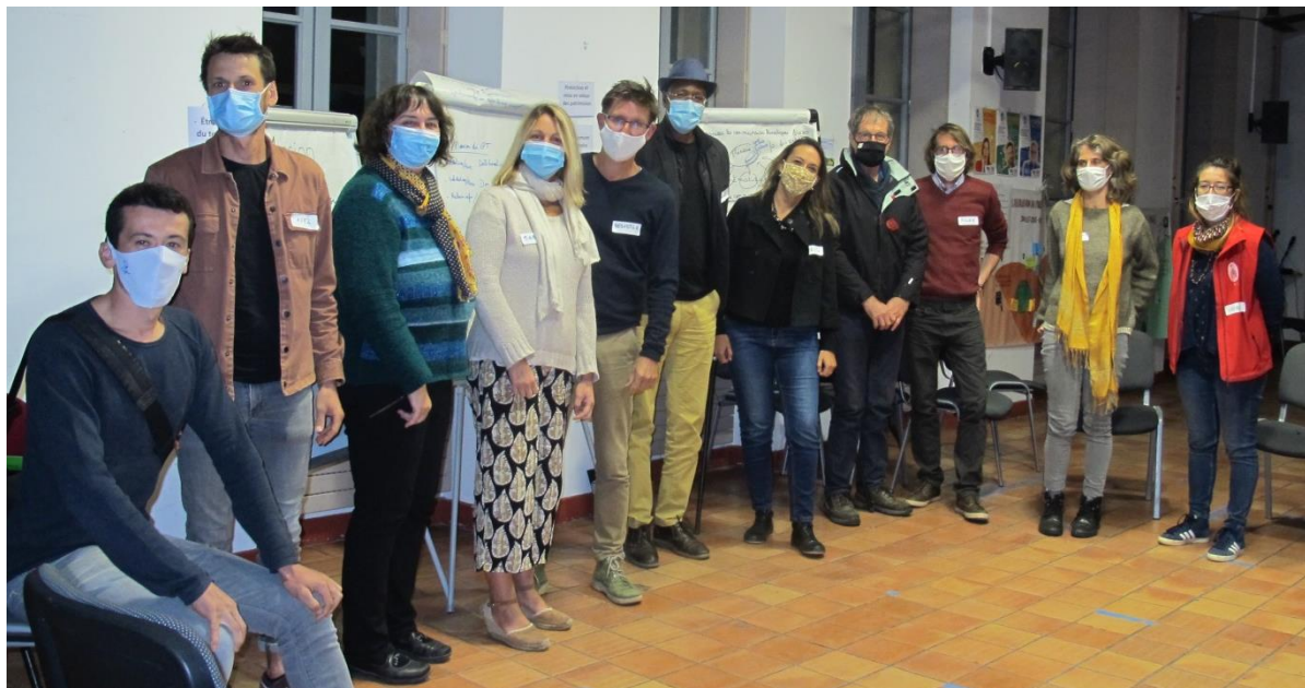
Groupe de préfiguration du Conseil territorial Luberon2039

ou remplir directement le formulaire en ligne au plus tard le 15 février 2021.