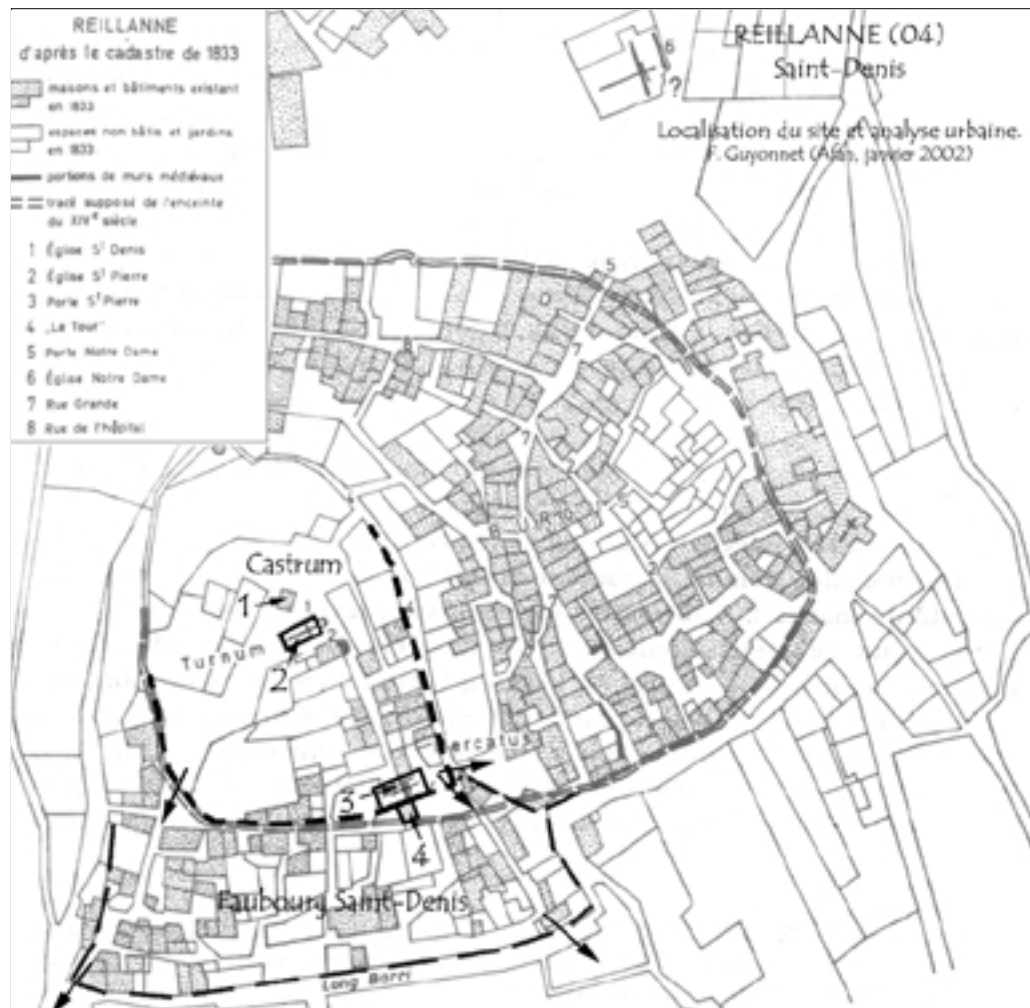
Fig.7 : localisation du site et analyse urbaine (dessin F. Guyonnet).

Localisation de l'enceinte et des églises de Reillanne sur le cadastre de 1833. Cf. Poppe, 1980, p. 31.