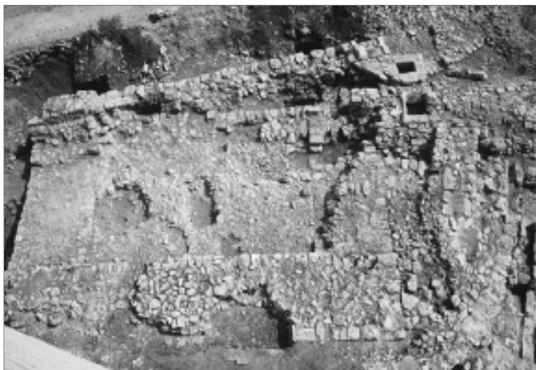
Fig. 8 : vestiges de la maison forte depuis le nord. On remarquera notamment le radier.