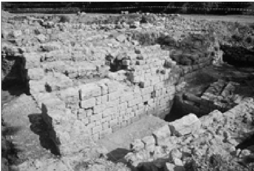
Fig. 10 : vue des vestiges de la cave depuis l'ouest.