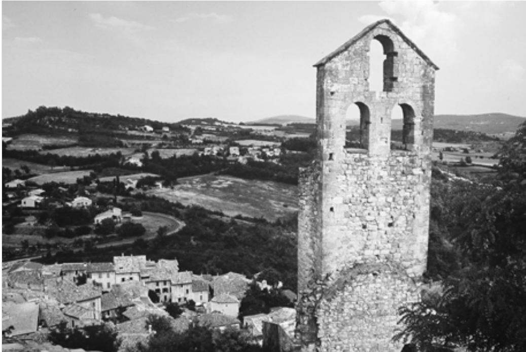
Fig. 1 : vue partielle du village bas, de son environnement et des vestiges de la chapelle castrale depuis le toit de l'église Saint-Denis.