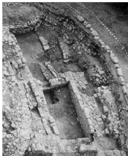
Fig. 9 : partie occidentale de la fouille archéologique depuis le nord.