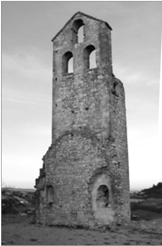
Fig. 4 : vestiges du chevet de la chapelle castrale et de la tour-clocher