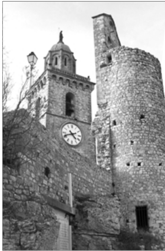
Fig. 5 : tour-clocher construite contre le chevet de la chapelle castrale. En arrière-plan la partie supérieure (XIX e siècle) du clocher de l'église Saint-Denis.