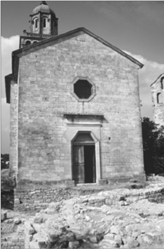
Fig. 3 : façade sud de l'église Saint-Denis.

Deux édifices forment l'environnement architectural de ce site pittoresque: l'église Saint-Denis et les vestiges d'une tour surmontée d'un clocher-mur. Ces bâtiments n'avaient fait l'objet d'aucune étude architecturale alors que les élévations conservées sont particulièrement intéressantes.