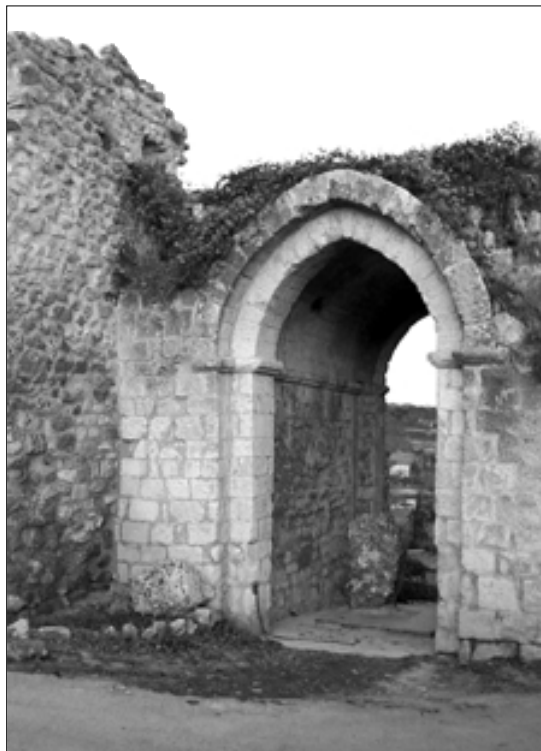
Fig. 6 : porte des forges ou Saint-Pierre.