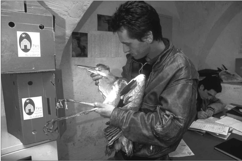
Un héron en soin au centre de sauvegarde de la faune sauvage de Buoux