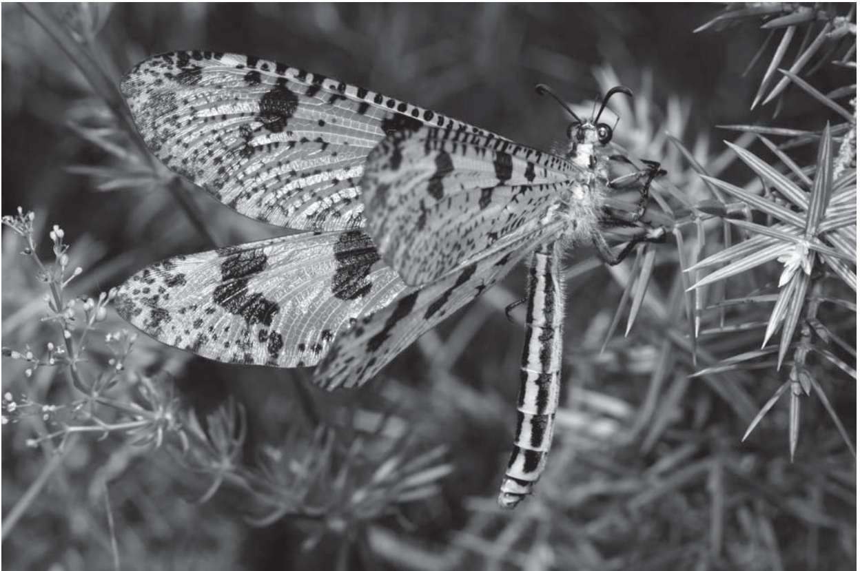
Palpares libelluloides - Envergure réelle : 100 à 120 mm