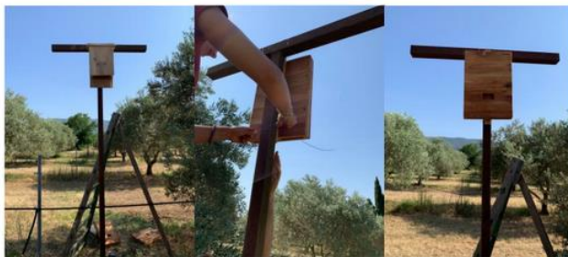
PETIT GUIDE POUR LA FABRICATION D'UN NICOIR A CHAUVES-SOURIS