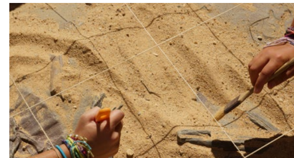
Détail du Géorium

Tarif: enfants 2€/adultes 7 €. Durée: 3h Ateliers mosaïques: 4, 18 juillet et 1 er août. Ateliers lampe à huile: 11 et 25 juillet.