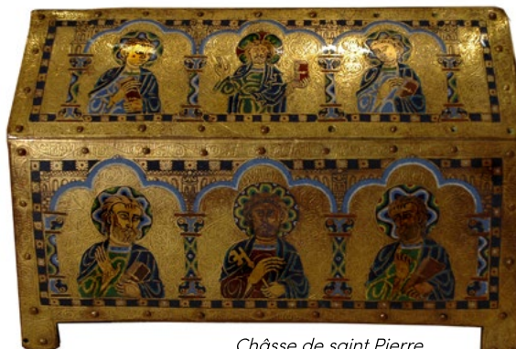
Châsse de saint Pierre. Trésor de la basilique d'Apt

Billet unique en vente au musée d'Apt. Tarif 10€, gratuité pour les – de 18 ans.