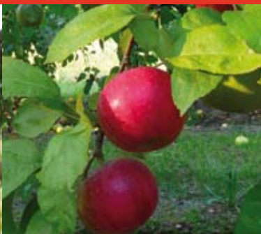
Provençale rouge d'hiver