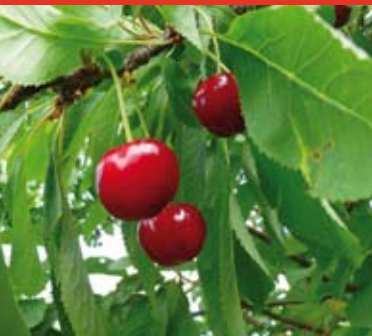
Griotte de Provence