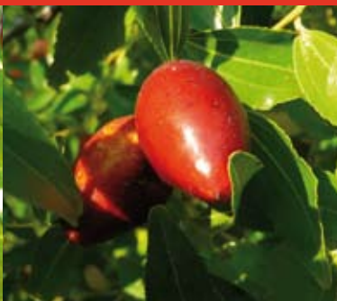
Jujube de Provence