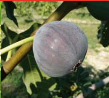
Figue Grise de Tarascon