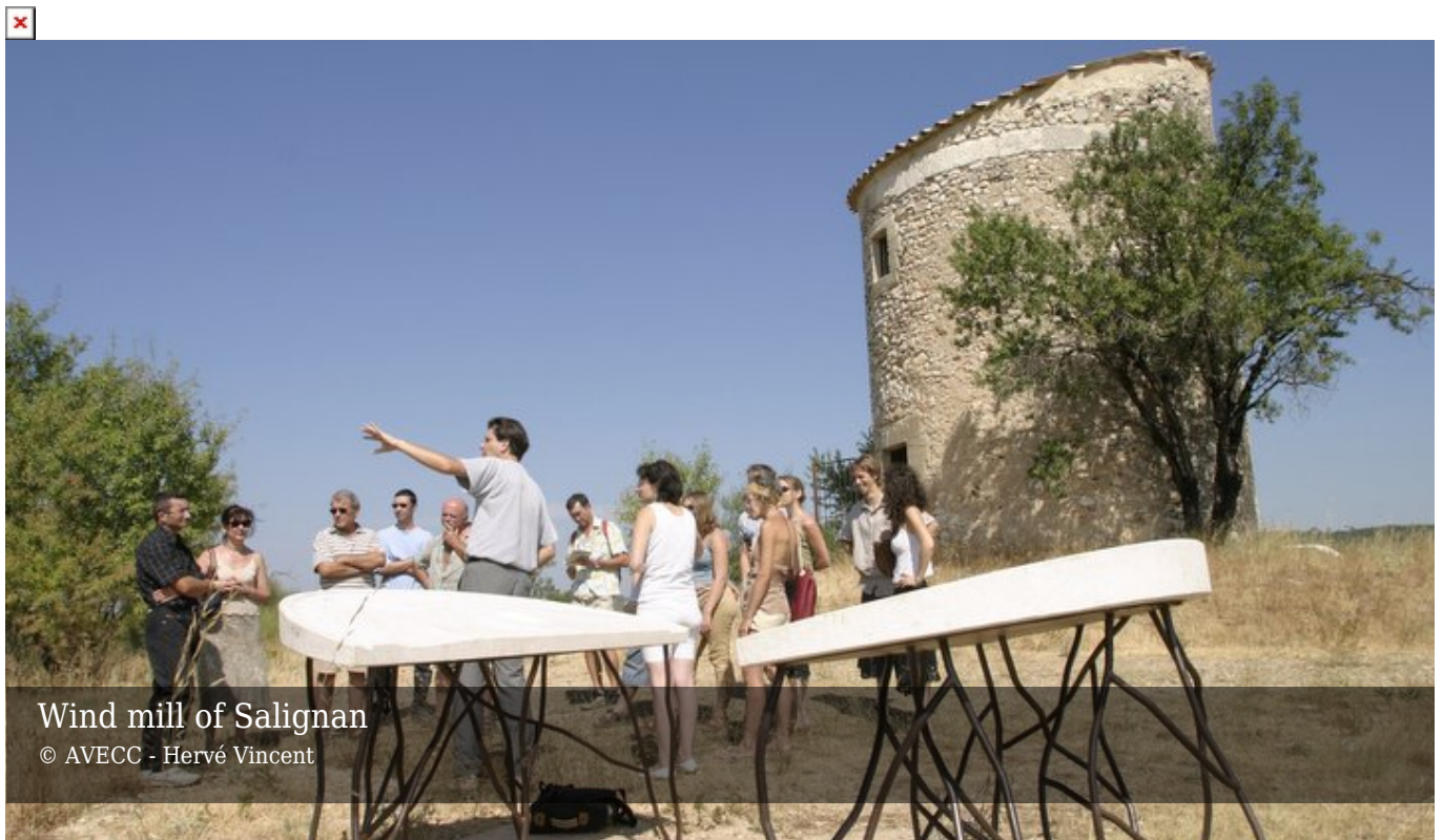
Wind mill of Salignan

Aux vacances d'été, embarquez pour un voyage à la découverte d'un pays d'Apt recouvert par la mer, il y a plus de 100 millions d'années. Rendez-vous au moulin de Salignan où les géologues du Parc vous présente une exposition sur les roches particulières que l'on trouve autour d'Apt. Ce sont des argiles grises très fossilifères. Venez découvrir leur histoire... et d'autres richesses locales !