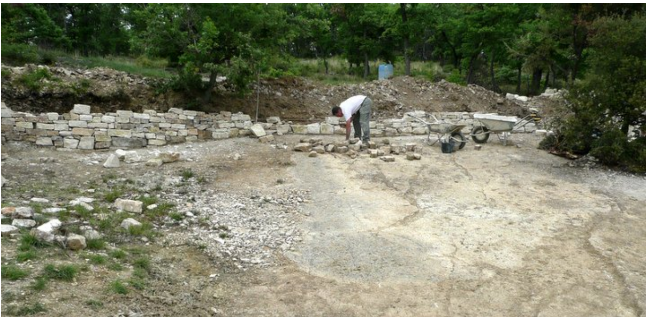
Construction of a wall to protect Viens's fossil tracks