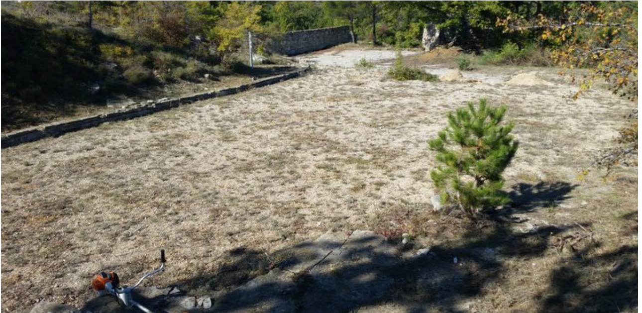
the fossil tracks of Saignon slab, covered with geotextile and sand to prevent erosion