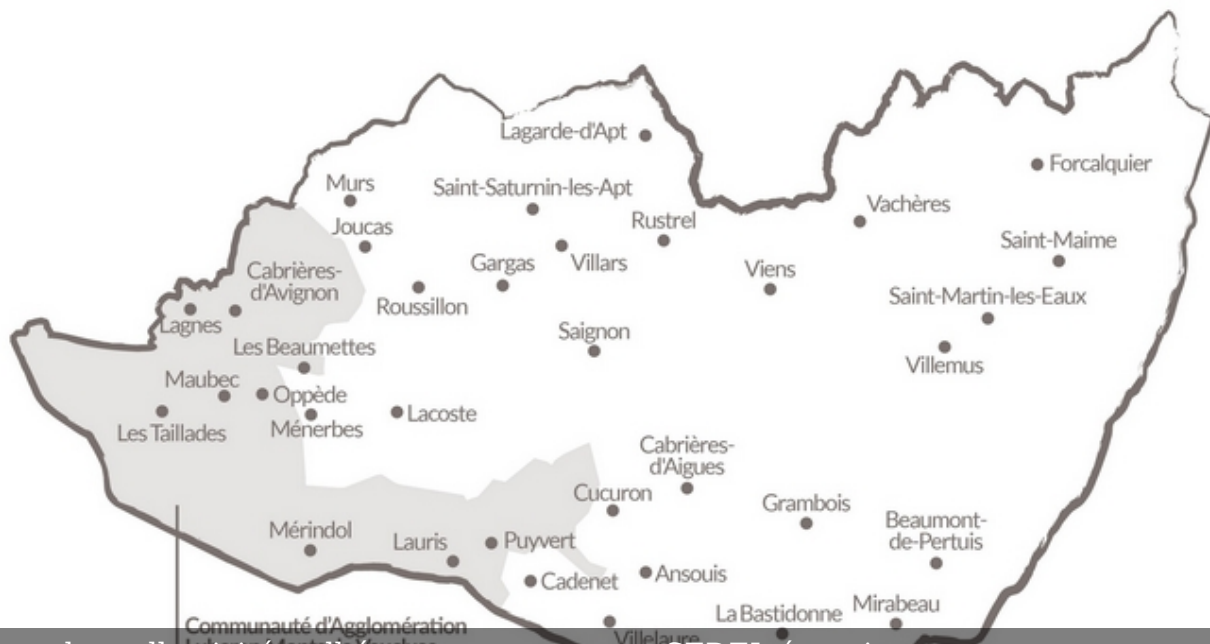
Carte des collectivités adhérant au programme SEDEL-énergie (SIT PNR PACA - Muriel Krebs)