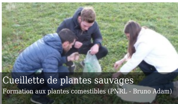
Cueillette de plantes sauvages

Ce fort partenariat a donné lieu à la mise en place d'un programme de formation par le Parc à destination de ce public au cours de l'année 2016-2017.