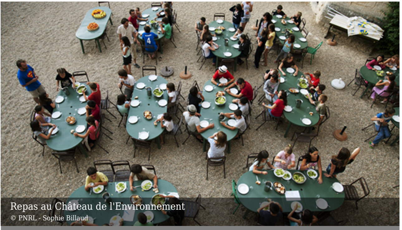
Repas au Château de l'Environnement