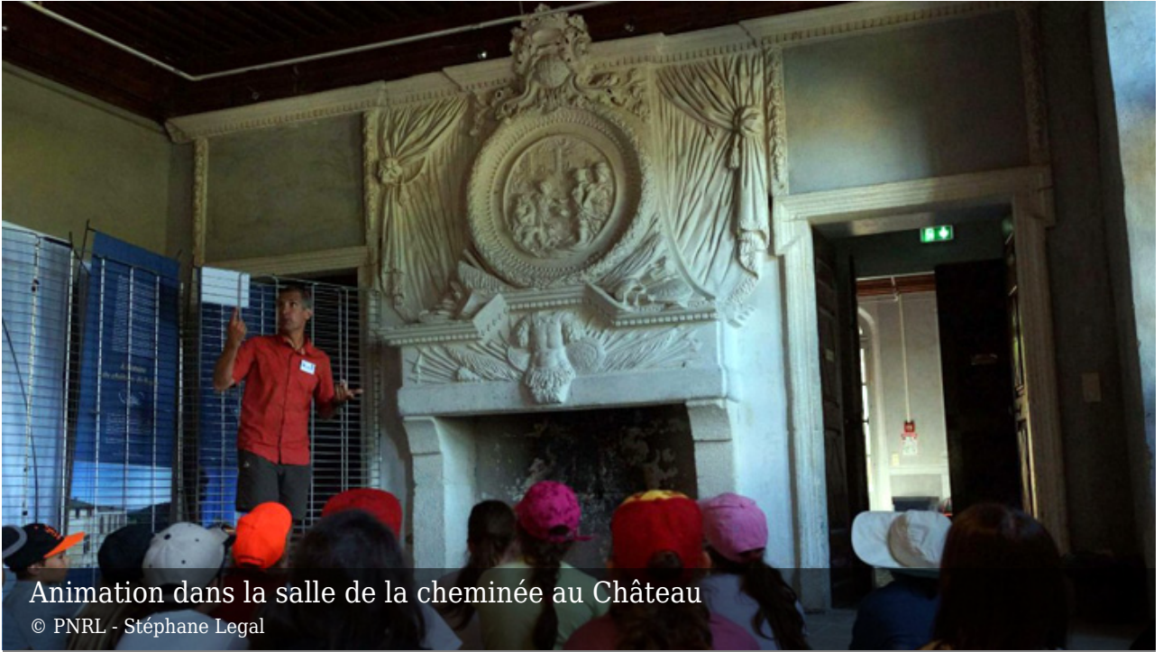
Animation dans la salle de la cheminée au Château