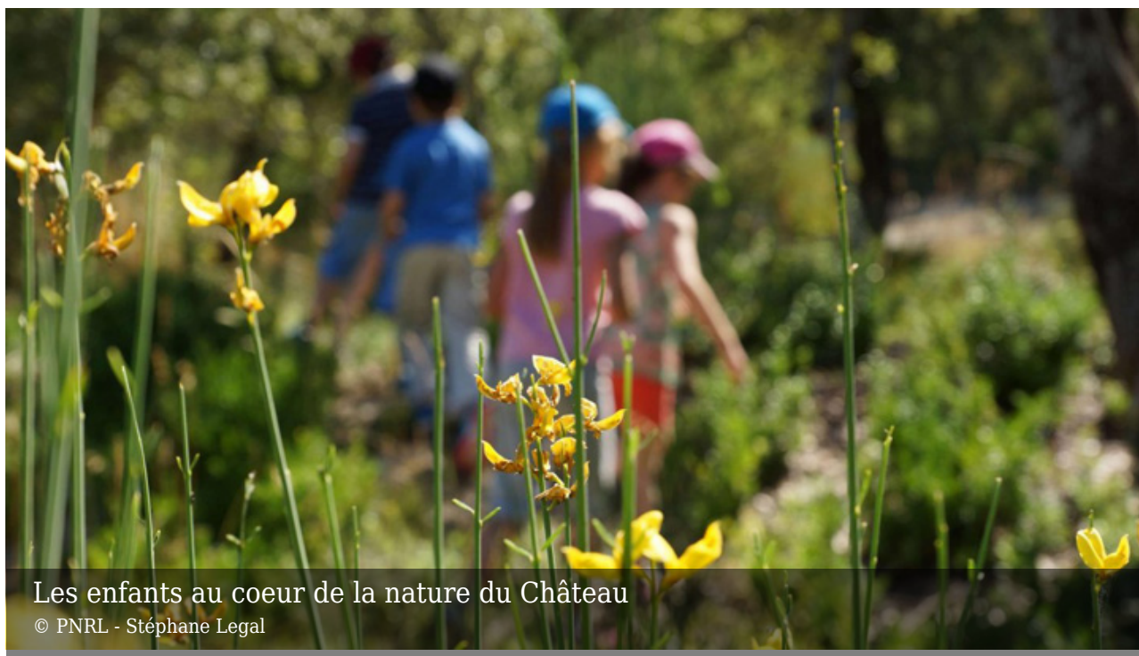
Les enfants au coeur de la nature du Château