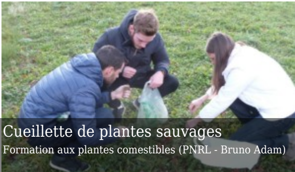
Cueillette de plantes sauvages

Ce fort partenariat a donné lieu à la mise en place d'un programme de formation par le Parc à destination de ce public au cours de l'année 2016-2017.