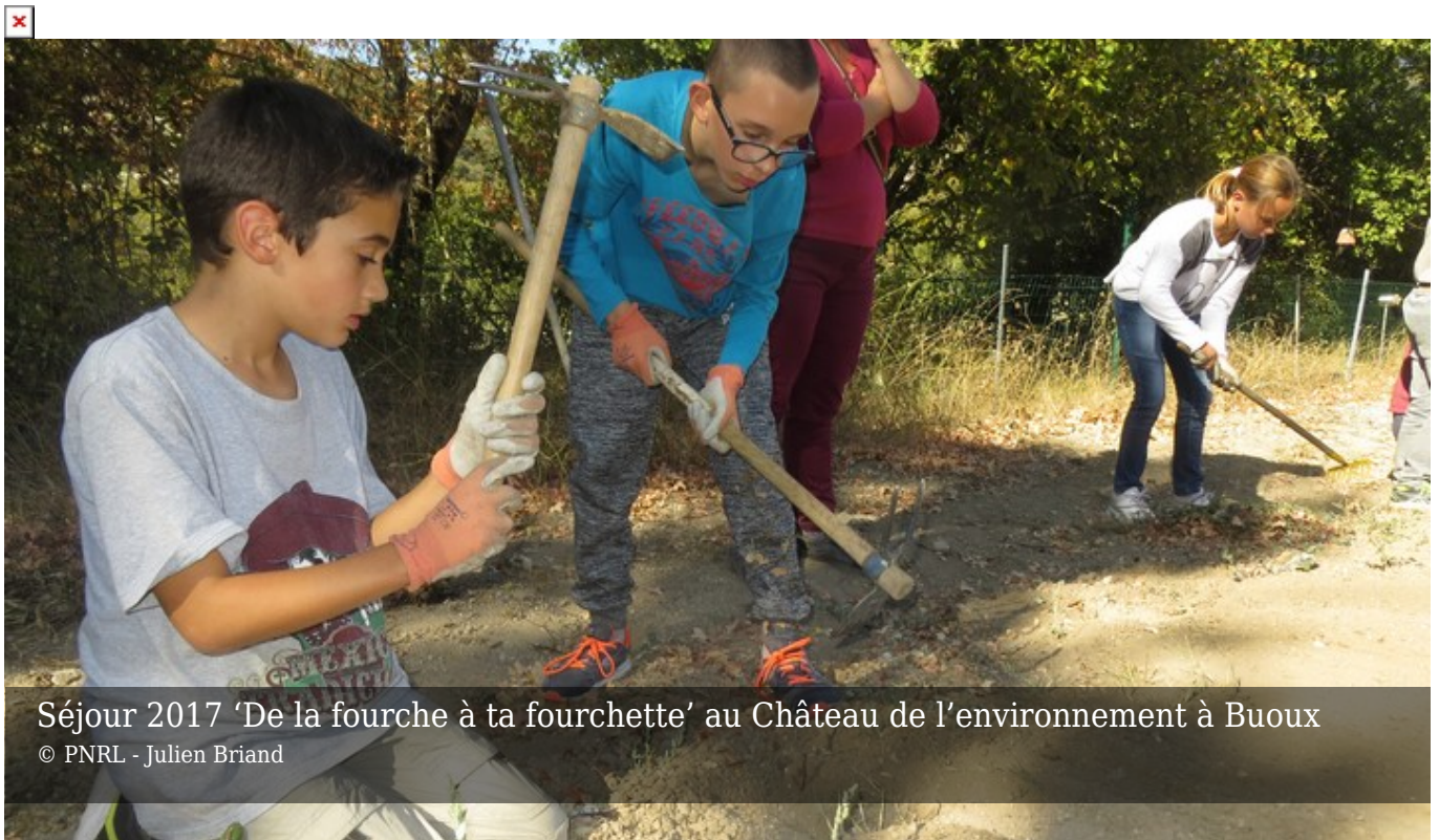
Séjour 2017 'De la fourche à ta fourchette' au Château de l'environnement à Buoux