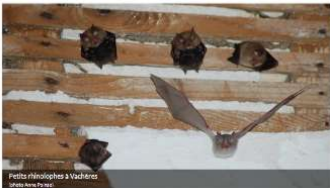
Petits rhinolophes à Vachères

Sur les 35 espèces présentes en France, 21 ont été recensées dans le Luberon. Cependant, les populations de chauves-souris ont très fortement diminué depuis les années 1960-1970, notamment à cause des activités humaines, et certaines sont actuellement menacées de disparition dans la région, à court et moyen termes.