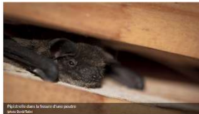
Pipistrelle dans la fissure d'une poutre

Les chauves-souris sont des animaux emblématiques du Luberon. Menacées de disparition, elles font l'objet d'actions de gestion menées par le Parc du Luberon, en particulier dans les sites Natura 2000 Inventaires, conservation des habitats, sensibilisation.