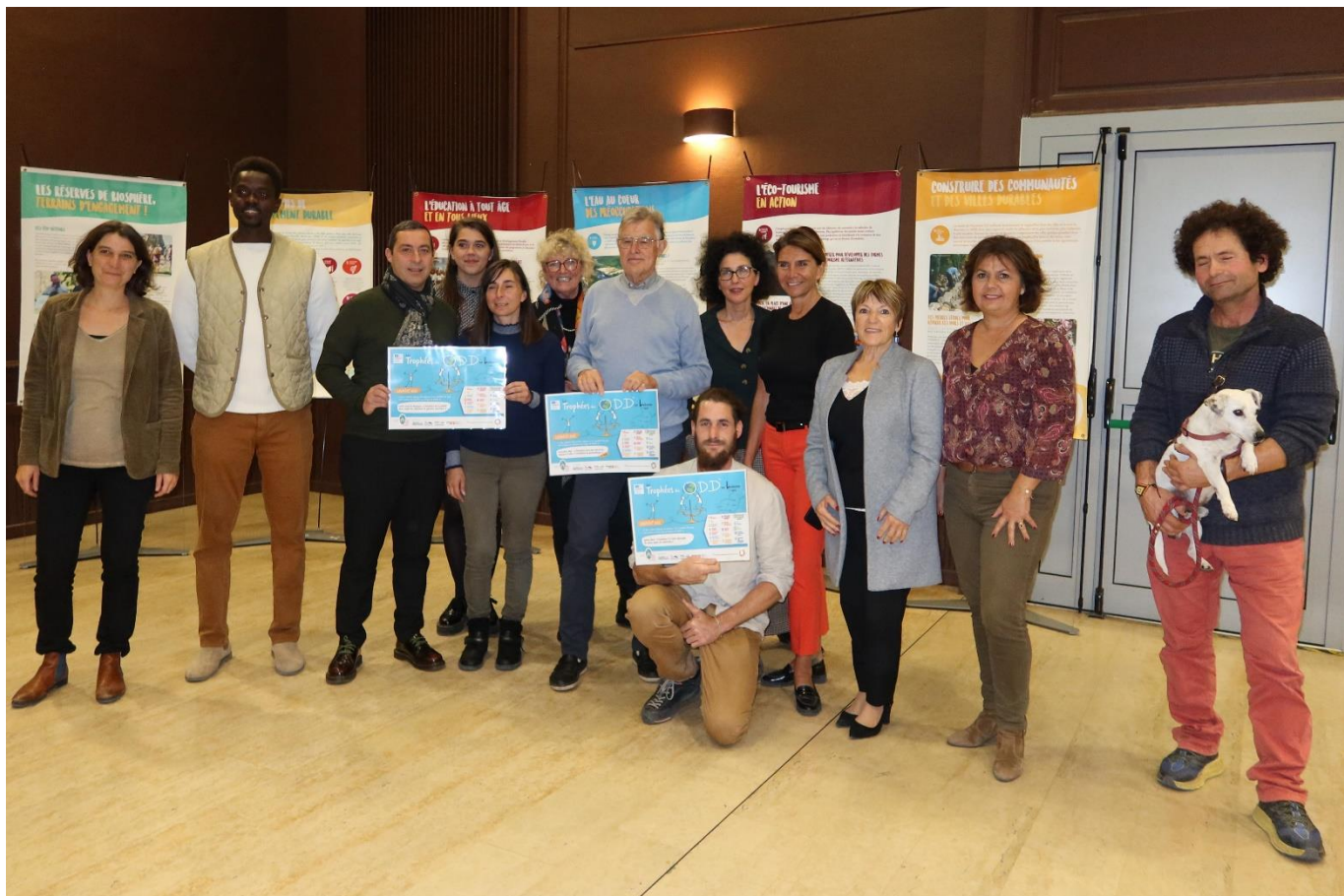
Légende photo : Présidente du Parc, délégués au Parc et lauréats des Trophées des ODD 2022.