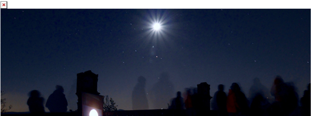
Le Parc du Luberon ouvre la voie