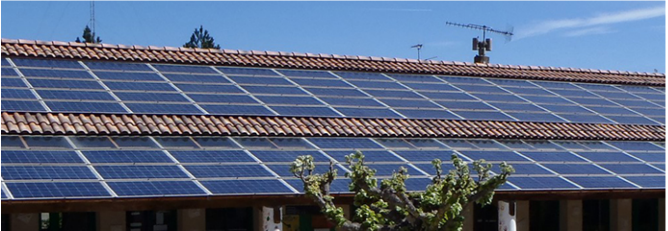
Produire de l'énergie