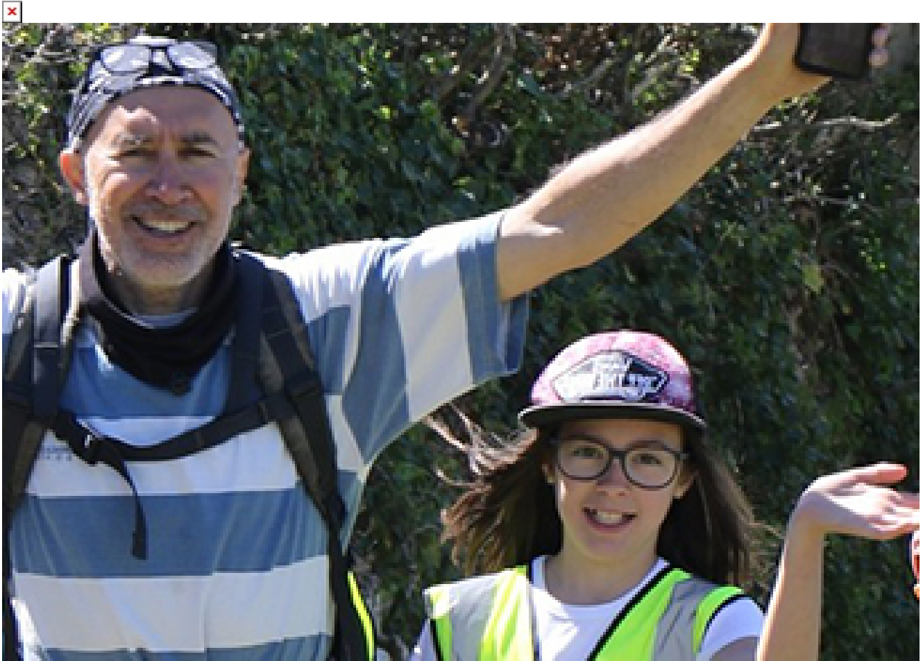
Géocaching en luberon

Front picture: Analysis of the flora in a meadow