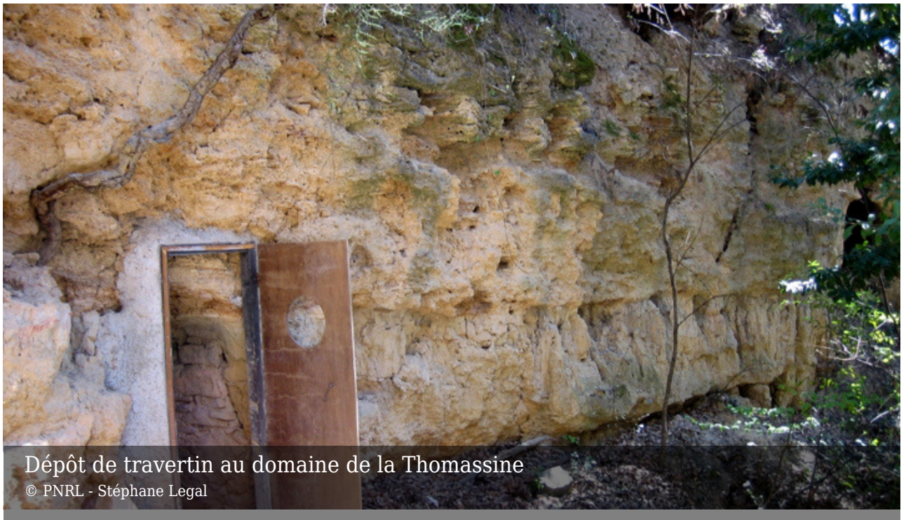
Dépôt de travertin au domaine de la Thomassine