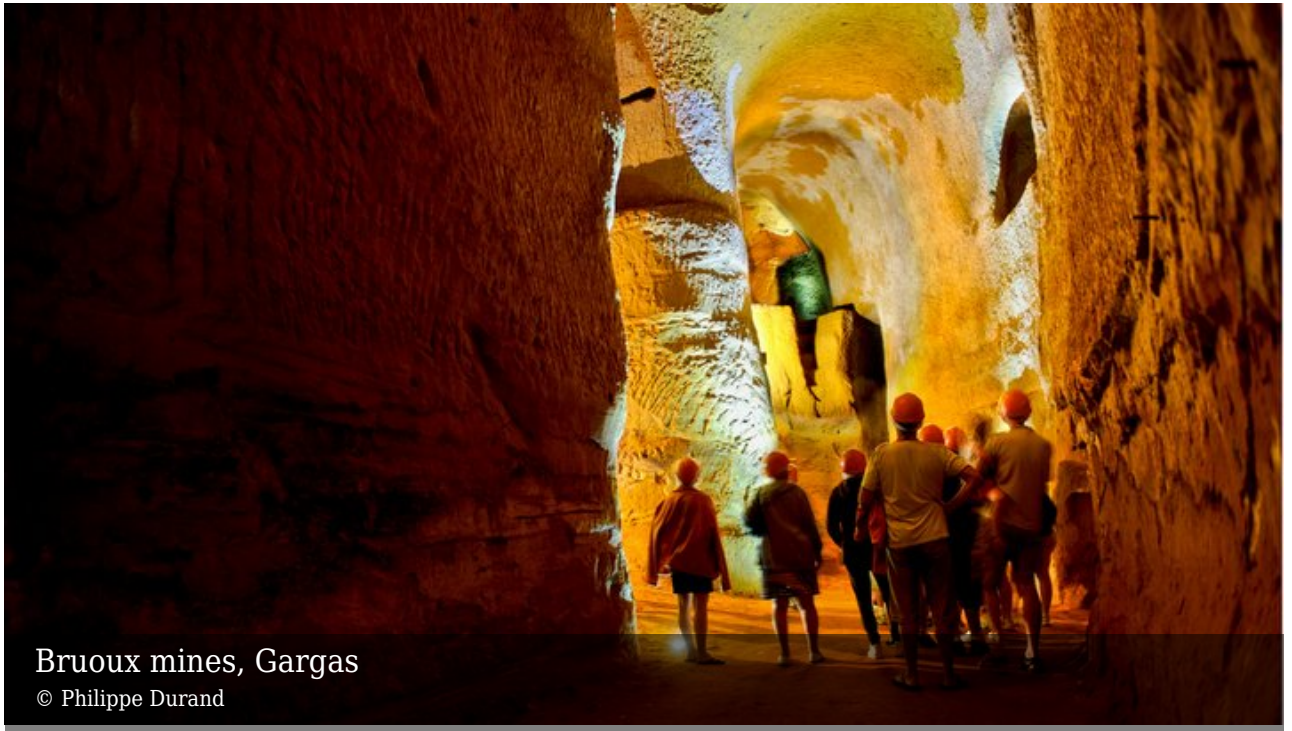
Bruoux mines, Gargas