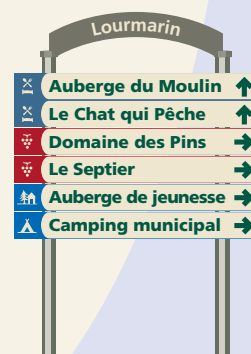
Exemple de barrettes en agglomération

notamment dans les villages à forte attraction touristique, vous pouvez faire figurer votre établissement sur des "barrettes" implantées selon un plan de jalonnement mis au point avec l'ensemble des activités concernées. Vous suivrez le code couleur "bleu" des activités d'hébergement et restauration.