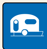
35 x 35 cm