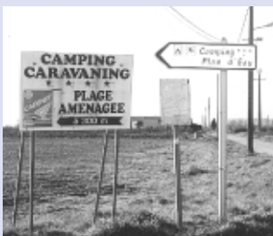
Ce camping cumule deux panneaux côte à côte, seul celui de droite est réglementaire. (Cadenet)

Ces photos illustrent la situation existante... L'application de la Charte signalétique améliorera le paysage et l'efficacité de l'information.