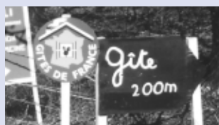
Ceci est une signalisation "sauvage". Les gîtes ruraux ont droit à des panneaux réglementaires avec idéogramme homologué. Le macaron Gîtes de France doit être utilisé en tant qu'enseigne, à l'entrée du gîte, sur sa propriété.