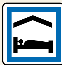
70 x 70 cm et 50 x 50 cm