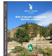
Plaquette d'appel pour les actions éducatives à la MDB

Le 24 juin, la journée Art et Nature a également permis aux 7 classes engagées dans cette action éducative tout au long de l'année de présenter leurs créations artistiques et de découvrir la richesse de ce site.